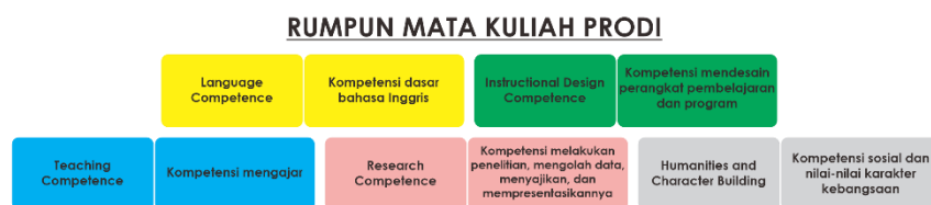
Gambar 4.1. Peta Kurikulum Prodi PBI 2021

Daftar mata kuliah Prodi PBI yang dilengkapi dengan kode mata kuliah, bobot SKS, harga SKS, kelas lab, dan keterangan prasyarat dapat dilihat pada Tabel 4.2 di bawah ini.